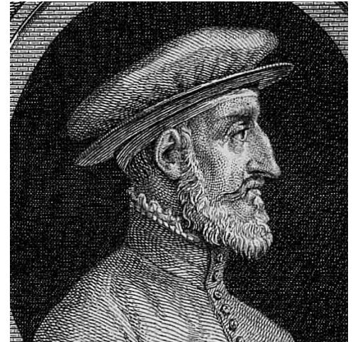
Pablo, hijo de Aldo Manucio, quien a los veintiún años de edad tomó en sus manos el negocio editorial de su padre. Más tarde lo heredaría, a su vez, a su hijo. Los tres personajes llenaron cien años de la tipografía italiana (1497-1597).

Aquí es donde el empleo de la letra cursiva por Aldo Manucio encuentra su verdadera gloria y su más legítima razón de ser. Esta letra, que empezó a utilizarse alrededor de 1500, fue cortada por Francesco Griffo. No se trató de un mero capricho de dibujante o de diseñador tipográfico sino de un genial recurso que, sin sacrificio de la belleza tipográfica, permitió un ahorro considerable en el costo, ahorro que Manucio aprovechó para bajar el precio de los libros –política no muy común en nuestros tiempos–.