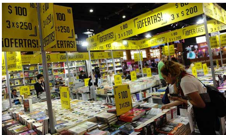
Una gran oferta editorial encontrarán los asistentes a esta feria.

Santiago de Compostela (2016) construyó un stand de 200 metros cuadrados, con un pequeño auditorio propio. Trajo a 30 autores (escritores, académicos, científicos, ilustradores, etc.), además de editores a las Jornadas de Profesionales. Imprimió un programa en tabloide, que sumó más de 80 actividades. Aportó autores al Festival Internacional de Poesía, al Foro de Enseñanza de las Ciencias y al Encuentro Internacional Borgeano. A la inauguración asistieron el presidente de la Junta y el alcalde de la ciudad.