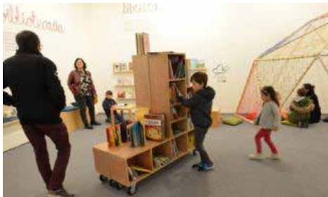
Las familias protagonizaron las visitas de los fines de semana.

Para la organización del Salón se ha contado con figuras de la literatura, especialmente la gallega,