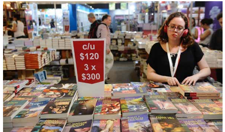
Un gran interés ha generado entre los jóvenes la FILBA.

Además de las actividades que realizó dentro de la Feria, tuvo un programa fuera de ella con exposiciones, visitas a escuelas y un festival de cine gallego en la sala Gaumont.