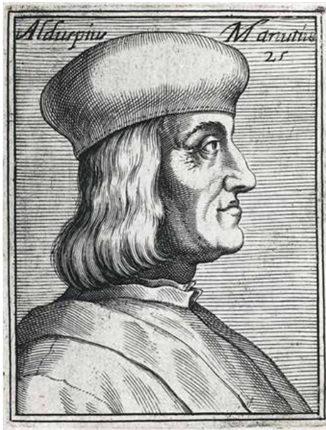
Aldo Manucio, llamado "el príncipe de los editores", según un grabado de principios del siglo xvi. Muchas imprentas contemporáneas llevan, en su honor, el nombre de "aldinas".

Manucio era hombre de letras. Estudió en las universidades de Roma y de Ferrara; conocía a fondo a los clásicos griegos; era un hombre de refinada educación, y se movía con soltura en la corte de los príncipes.